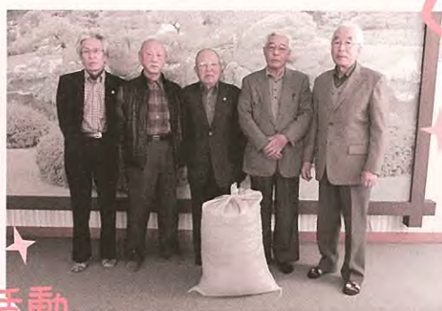
リングプル収集活動