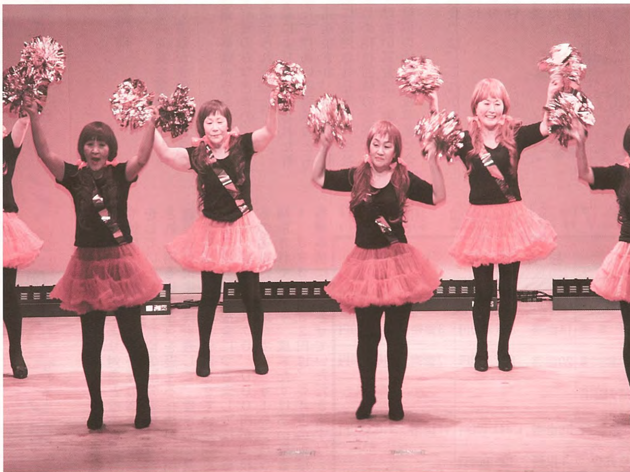
第32回歳末チャリティショーでのワンシーン