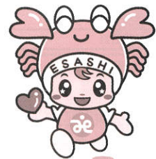
枝幸町社会福祉協議会 マスコットキャラクター えさしっぴー