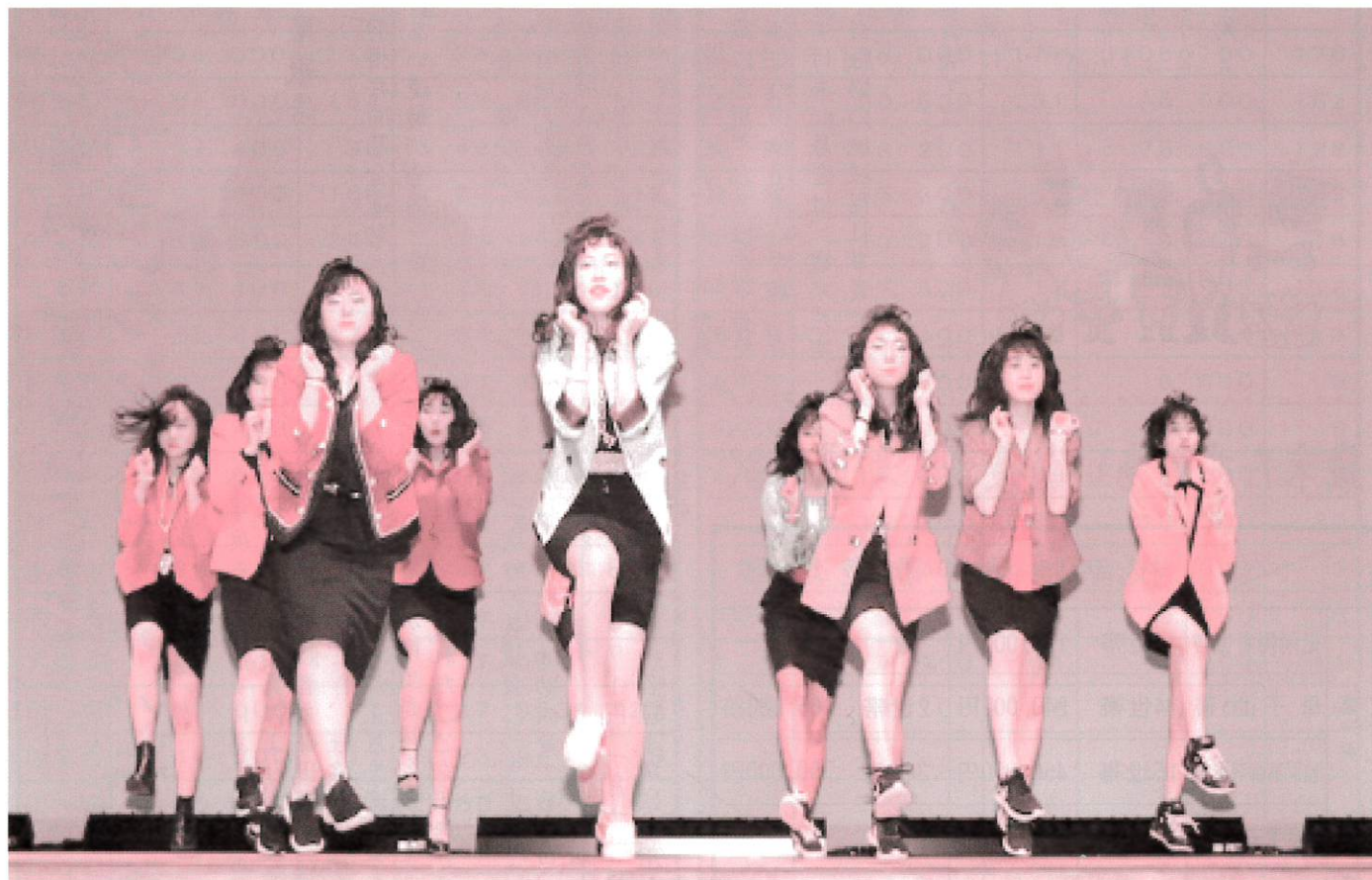
♪第36回歳末チャリティショーでのワンシーン♪