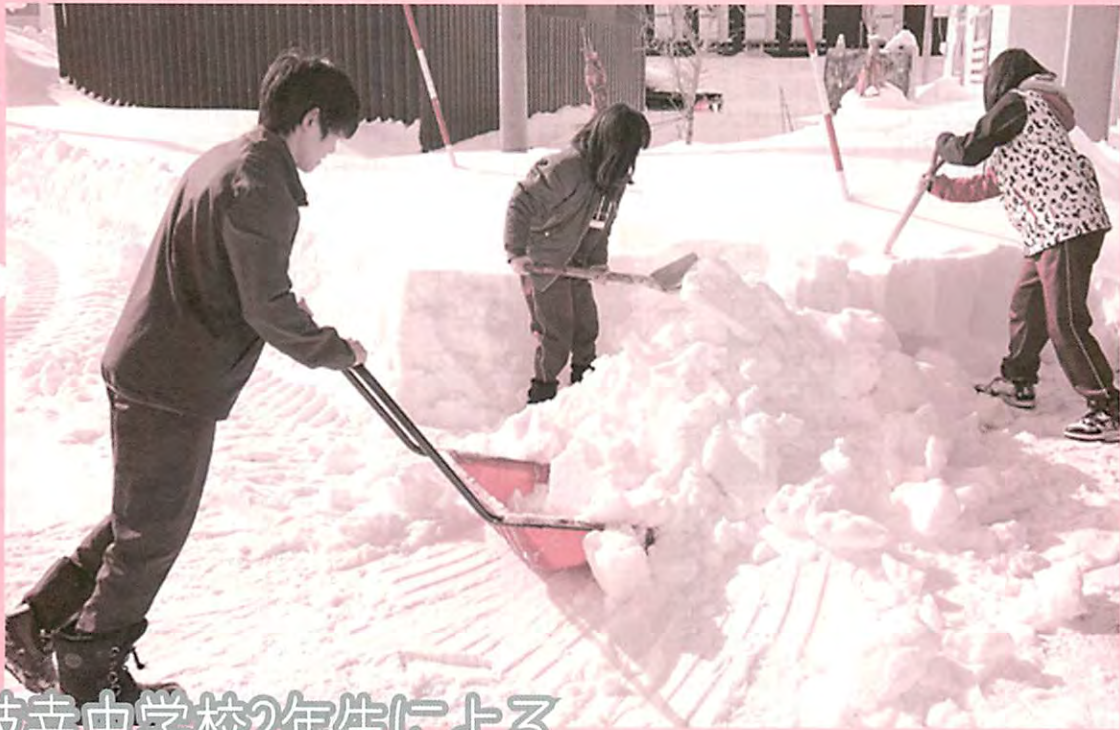
枝幸中学校2年生による 除雪ボランティアが行われました♪